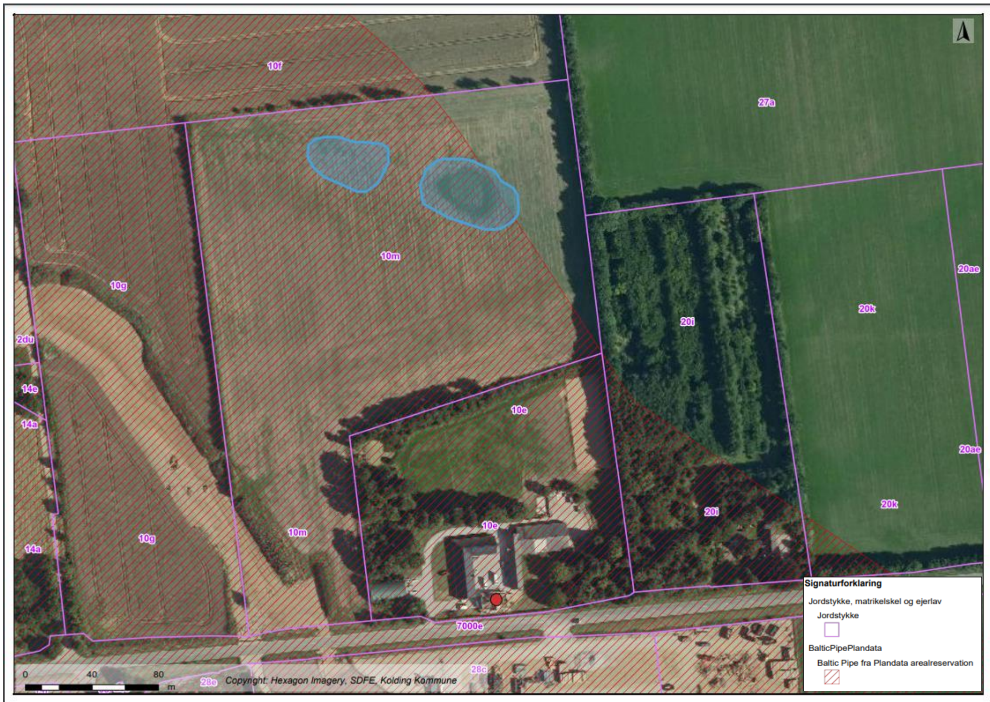
Kortbilag 2: Luftfoto, der viser søernes (de lyseblå polygoner) placering på matriklen. Søerne er skitserede med en størrelse på ca. 1200 m 2 for den vestlige sø og ca. 1900 m 2 for den østlige sø.